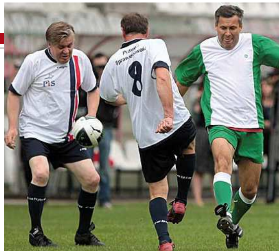
Poseł grywa w większości meczów samorządowych pod Warszawą

W okres nowych rządów powinniśmy wejść świadomi wszystkich realiów, nie